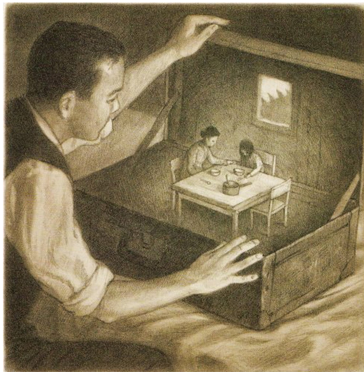
Là où vont nos pères Shaun Tan